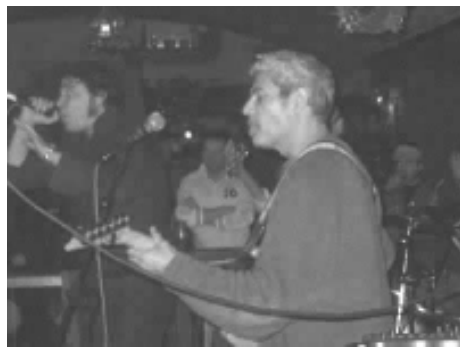
i Lega Leggera

Si è svolta nei mesi scorsi al Jamaica Inn di Boscoreale (NA) la seconda edizione dell'A.I. B.A.N.D. (Ban Any Normal Discrimination), concorso di gruppi musicali della zona a sostegno della campagna “Mai più violenza