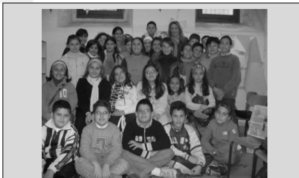
Piccoli Amnestiani Crescono - Gruppo di Lavoro delle V classi del 2° circolo didattico di Pomigliano d'Arco

I risultati ottenuti, ad oggi (dopo 5 incontri), sono confortanti e rafforzano la convinzione dell'utilità di questo percorso sperimentale. Il gruppo di Pomigliano è ben lieto di comunicare informazioni specifiche agli altri gruppi o a singoli insegnanti e scuole che vorranno intraprendere attività simili, anche per il prossimo anno scolastico.